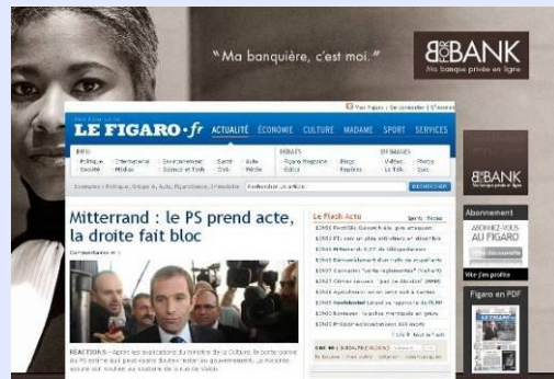
Habillage de page