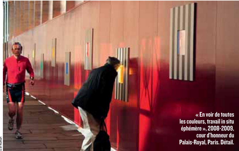
« En voir de toutes les couleurs, travail in situ éphémère », 2008-2009, cour d'honneur du Palais-Royal, Paris. Détail.

Peut-on installer une œuvre contemporaine dans un site historique classé ? En 1986, sous le ministère de Jack Lang, les colonnes de Buren alignées comme à la parade dans la cour d'honneur du Palais-Royal avaient créé une polémique. Avec le temps, le public s'est converti à cette cohabitation culturelle. Daniel Buren – l'artiste français le plus réclamé dans le monde – a poursuivi son chemin accompagné de ses « outils visuels » (bandes verticales de 8,7 centimètres de largeur). Cet été, ses œuvres ont été vues au Palazzo Grassi à Venise (Fondation Pinault), au cœur de Metz à l'occasion de l'exposition « Constellation », avant-goût de la programmation du futur Centre Pompidou-Metz. Sur le seuil, dans la couleur, travail in situ , une œuvre qui ouvrait la dernière édition de « La Force de l'art » au Grand