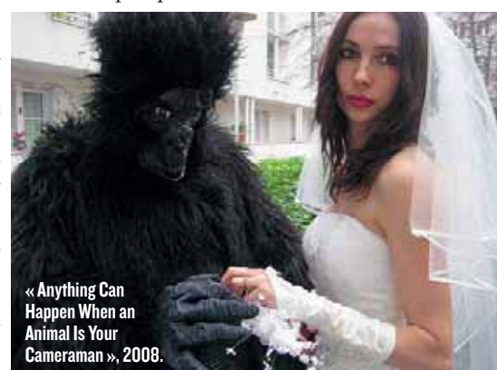
« Anything Can Happen When an Animal Is Your Cameraman », 2008.

Après avoir exposé chez Kamel Mennour, il a rejoint David Zwirner à New York. Mais c'est au Mamco (musée d'art contemporain de Genève), en 2004, qu'il fut repéré par François Pinault. L'homme d'affaires souhaitait faire l'acquisition d' Habibi , charmant squelette de 17 mètres de long,