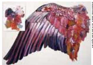
MUSÉE DES BEAUX-ARTS D'ANGERS

Louis Bourgeois, Joséphine Beuys, Jeanne Nouvel, Francine Bacon... Les tondos - œuvres circulaires - d'Agnès Thurnauer, 48 ans, ouvrent l'accrochage de elles@centrepompidou. En inversant le sexe des artistes, Agnès Thurnauer réinvente à sa manière l'histoire de l'art. L'année 2003 la consacra au Palais de Tokyo et, depuis l'été, elle fait partie des collections du musée d'Angers ( Grande prédelle rouge , 2009, ci-contre). « Le temps, c'est de l'espace, nous ne sommes plus dans une histoire linéaire avec des avant-gardes systématiques. » En 1987, elle se met à suivre des cours de cinéma et de vidéo. Son « art total » lui vaut d'être demandée à New York, en Allemagne et même en Chine.