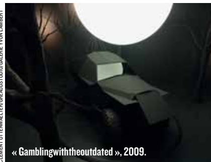
« Gamblingwiththeoutdated », 2009.

show à la Kunsthalle Sankt Gallen, en Suisse, à l'ICA (Institute of Contemporary Arts), à Londres. « Le 19 novembre, à l'occasion de la foire d'Abu Dhabi, je vais réaliser une sculpture pyrotechnique qui sera ensuite relayée sur tous les écrans de Times Square à New York. » Autant de projets excitants pour un artiste jusqu'au-boutiste qui s'amuse à « pousser les utopies afin qu'elles entrent dans notre réalité ». A voir à la Galerie Yvon Lambert à la Fiac.