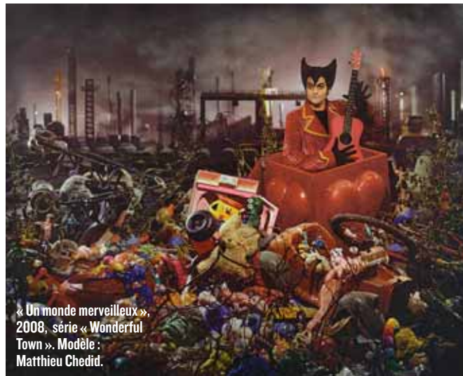
« Un monde merveilleux », 2008, série « Wonderful Town ». Modèle : Matthieu Chedid.