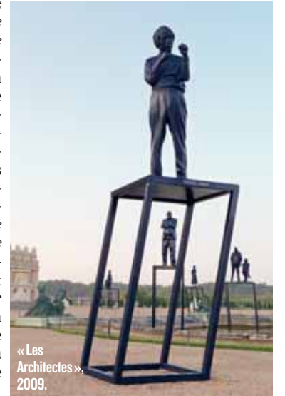
« Les Architectes », 2009.