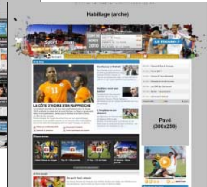
HP site dédié