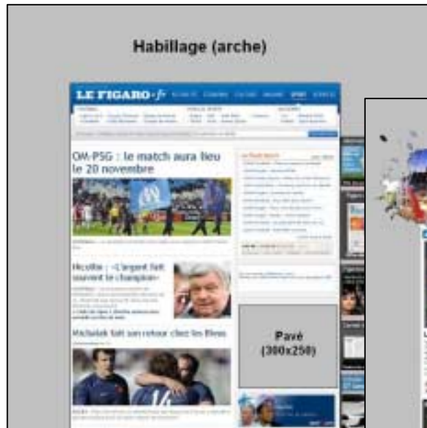
rubrique SPORT du figaro.fr